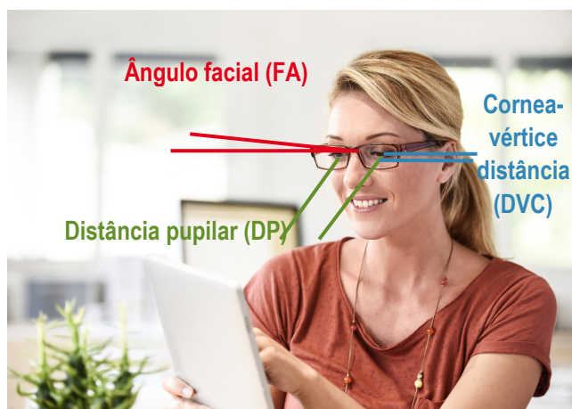
Figura 3: Parâmetros individuais da situação montagem